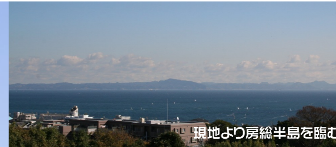
現地より房総半島を臨む