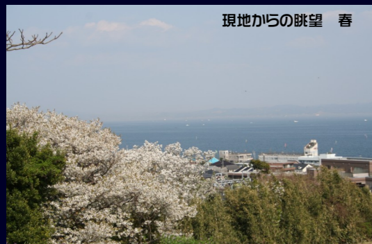
現地からの眺望 春